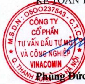
Phùng Đức Trường